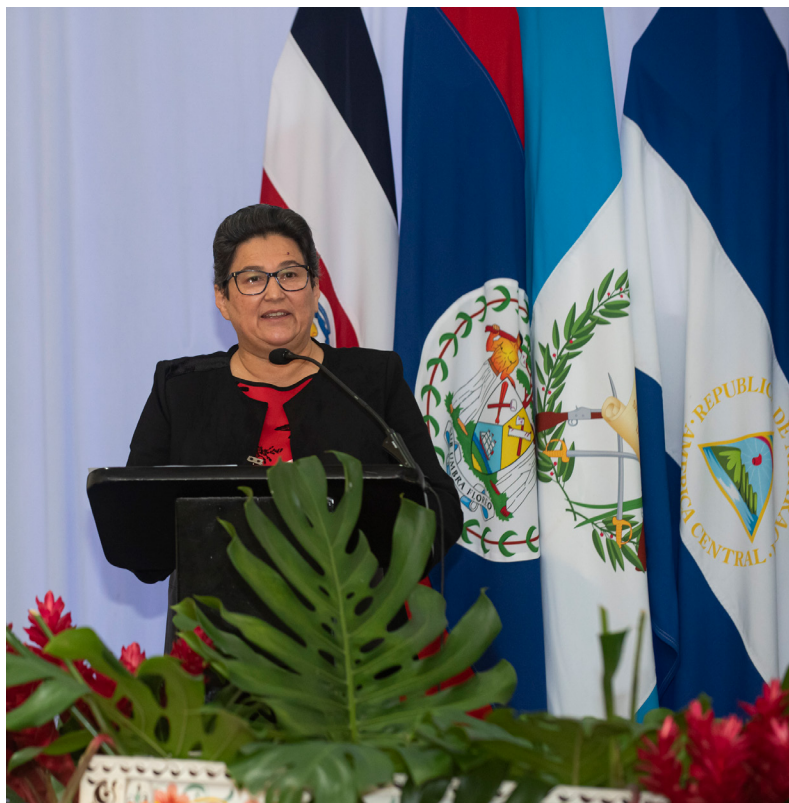
La directora de Geología y Minas de Costa Rica, Ileana Boschini, fue la presidenta del XIV Congreso Geológico de América Central y VII Congreso Geológico Nacional.

14cgac.geologos.or.cr/wp-content/uploads/2022/07/MEMORIA%20XIV%20CGAC%20interactiva.pdf