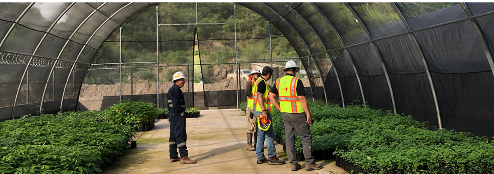
Vivero para reforestación, Mina Palmarejo, Chihuahua, México

Específicamente en el campo minero, Oliveira et al. (2017) evaluaron la ecoeficiencia de varias corporaciones mineras y propusieron los siguientes cinco criterios para la medición de la ecoeficiencia: 1) Competitividad del negocio y generación de riqueza, 2) el uso de recursos no renovables, 3) disminución de dispersiones (desechos, emisiones al aire, derrames, pasivos ambientales o daños ambientales), 4) uso sostenible de recursos renovables con responsabilidad social, y 5) conservación (recuperación, protección de hábitat, protección de especies protegidas y biodiversidad).