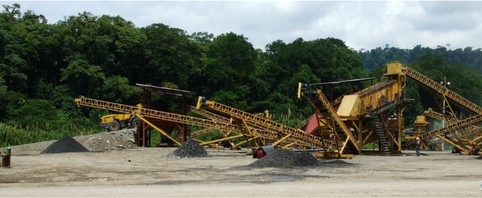
Proceso de trituración y cribado de agregados. Quebrador 1, PH Reventazón-ICE.